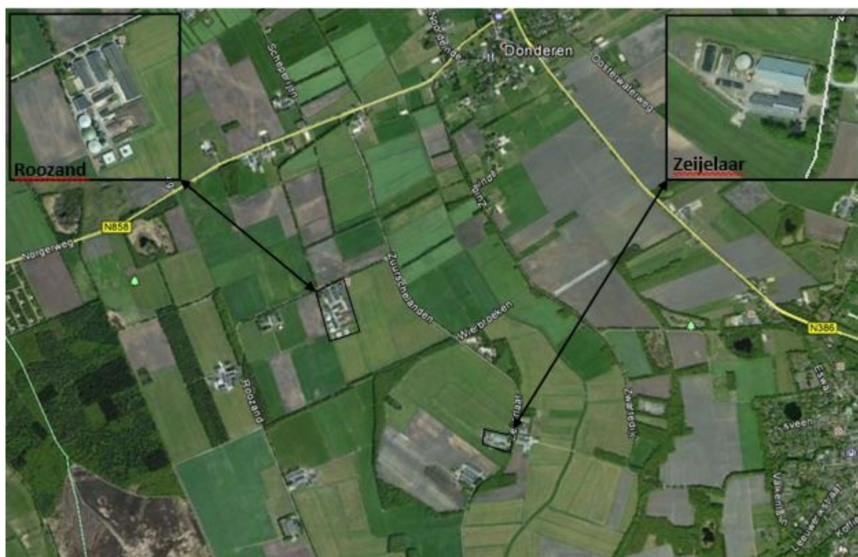
Figuur 1 Overzicht locaties

Milieu neutrale melding: 3 maart 2017, het bijplaatsen van 3 gelijke biomassa kachels.